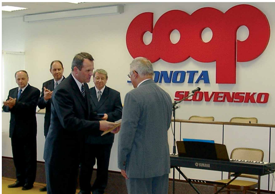
Odvzdávanie Družstevnej ceny Samuela Jurkoviča vyznamenaným družstevným kolektívom a jednotlivcom dňa 30.6.2004.